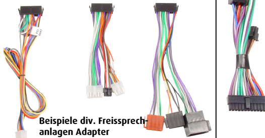
Beispiele div. Freisprechanlagen Adapter

Das vollständige Audio2Car Freisprechanlagen-Adapter Sortiment finden Sie auf unserer Internetseite: www.kram.dk