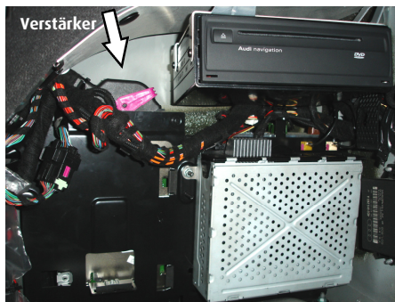
Abb. Verstärker Positionen im Audi A8

6. Verlängerungskabel verlegen. Verlängerungskabel B (oder zusätzliche Drive & Talk Mute-Box mit Verlängerungskabel) zur bevorzugten Einbauposition der Freisprechanlage verlegen, z. B. hinter dem Handschuhfach.