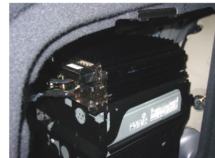
Foto: Verstärker im Modell bis-2006. Benötigt einen abweichenden Kabelsatz.