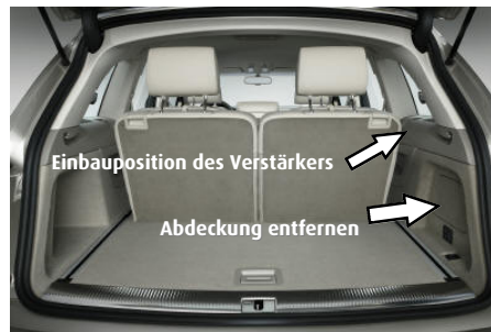
Amplifier location in Audi Q7

re Sicherungen austauschen. Achtung: Niemals die max. Sicherungsstärke für das Audio2Car Kabel überschreiten. (siehe auch: Technische Daten auf Seite 1)