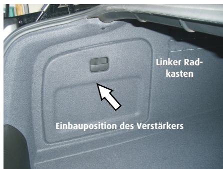
Verstärker Einbauposition in Audi A6 u. A6 Allroad