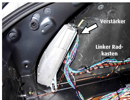
Abb. Verstärker Positionen im Audi TT