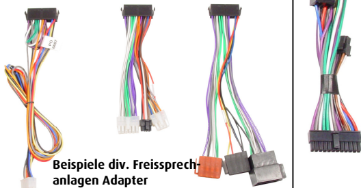
Beispiele div. Freisprechanlagen Adapter

Das vollständige Audio2Car Freisprechanlagen-Adapter Sortiment finden Sie auf unserer Internetseite: www.kram.dk