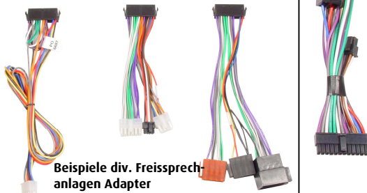
Beispiele div. Freisprechanlagen Adapter

Das vollständige Audio2Car Freisprechanlagen-Adapter Sortiment finden Sie auf unserer Internetseite: www.kram.dk