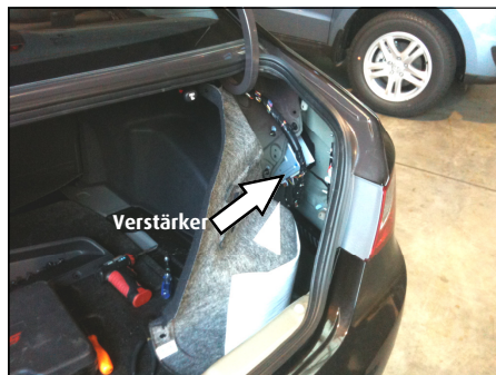
Verstärker Position in i45 / Sonata