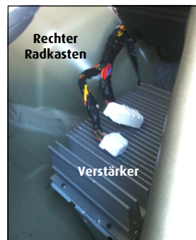
Verstärker im Kia Sportage