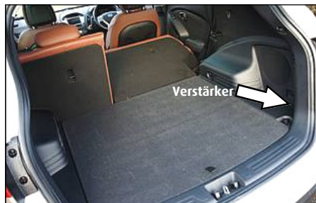
Verstärker Position in ix35 / Tucson