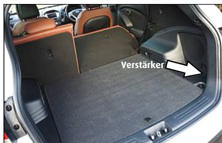
Verstärker Position in ix35 / Tucson