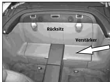
Verstärker Position in Mercedes SL-Class R230