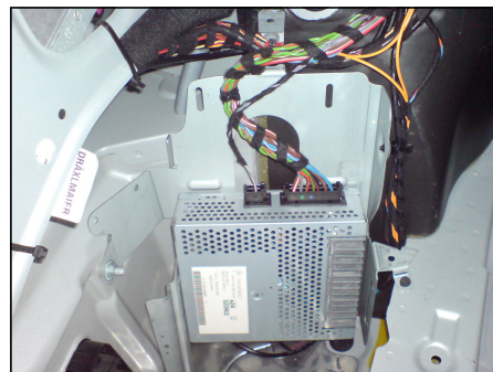
Verstärker in S u. CL-Klasse