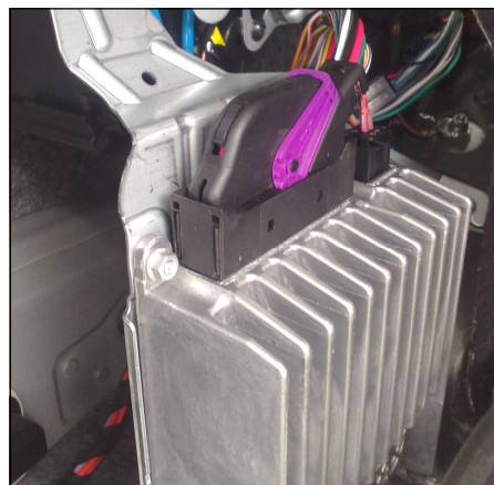
Foto: Verstärker in E-Klasse W212