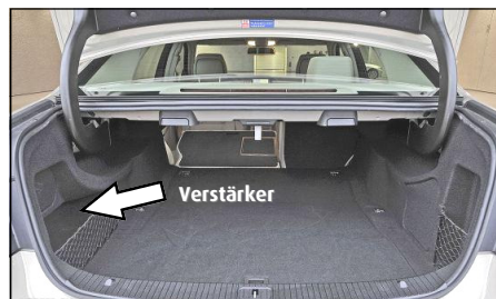
Verstärker Position in E-Klasse W212