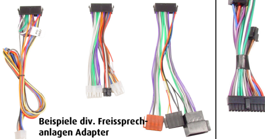
Beispiele div. Freisprechanlagen Adapter

Das vollständige Audio2Car Freisprechanlagen-Adapter Sortiment finden Sie auf unserer Internetseite: www.kram.dk