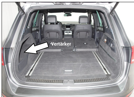
Abb.: Verstärker Position

bigen geschalteten Zündungsquelle angeschlossen werden.