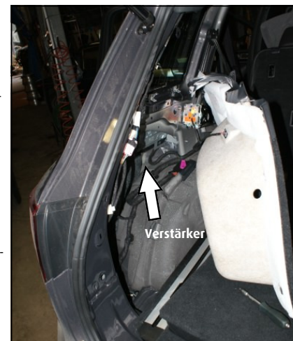
Abb.: Verstärker Position

7. Freisprechanlagen-Adapter anschliessen. Freisprechanlagen-Adapter an Verlängerungskabel und Freisprechanlage anschliessen.