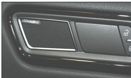
Abb.: Dynaudio Logo auf Lautsprecherblende