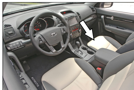
Verstärker Position Kia Sorento