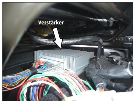
Foto: Verstärker unter dem Sitz