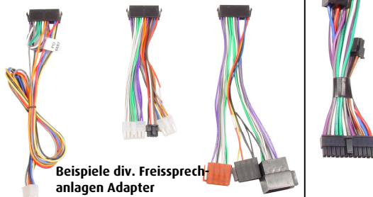
Beispiele div. Freisprechanlagen Adapter

Das vollständige Audio2Car Freisprechanlagen-Adapter Sortiment finden Sie auf unserer Internetseite: www.kram.dk