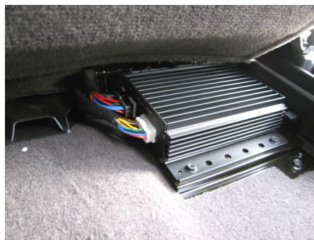
Verstärker Position in Santa Fe