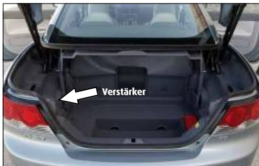
Verstärker Position in Volvo C70

5. Sicherungsstärke prüfen. Die Sicherungen im Audio2Car Kabel sollten nicht größer ausgelegt sein als die Sicherungen im Kabelsatz der Freisprechanlage. Ggf. die Sicherungen im Audio2Car Kabel durch in der Stromstärke vergleichbare Sicherungen austauschen. Achtung: Niemals die max. Sicherungsstärke für das Audio2Car Kabel überschreiten. (siehe auch: Technische Daten auf Seite 1)