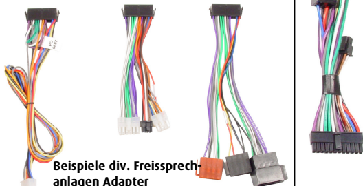
Beispiele div. Freisprechanlagen Adapter

Das vollständige Audio2Car Freisprechanlagen-Adapter Sortiment finden Sie auf unserer Internetseite: www.kram.dk